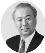
株式会社 大竹製作所 代表取締役社長