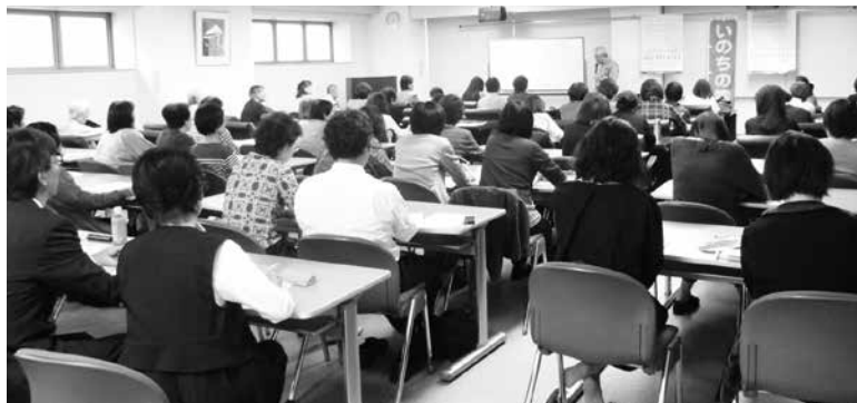
熱心に講演を聴く参加者

私はいのちの電話に関わって、すごく良かったと思ったのは、答えのない世界、安易に答えてはいけない世界に対して、どう受け止めていくのかということにまともに取り組んでいることです。元々自殺予防の電話ということもありますが、存在がかかっているからです。存在承認ということ。