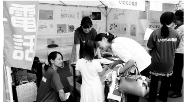
いのちの電話広報ブース

が6割にのぼり、20～30代までは半数以上の人が「自分への満足感があるか？」との問いに「いいえ」と回答しました。他人の目を気にして自己満足感が得られにくい、という傾向があるように感じます。このアンケートの結果は、街中のリアルな声を反映しているといえるでしょう。また、驚いたことに何人かの小学生が、いのちの電話を知っていると答えており、いのちの電話は老若男女問わず必要とされている時代にさしかかっていることを実感しました。