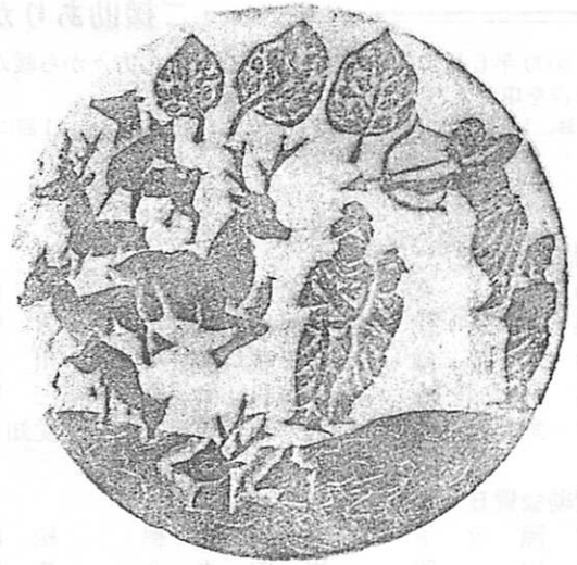
子を宿した牝鹿にかわって犠牲になろうとする鹿の王(ジャータカ)

仏教でもこの達観の知恵を人生の最終目標にかかげています。これは決して死、そして生命を軽