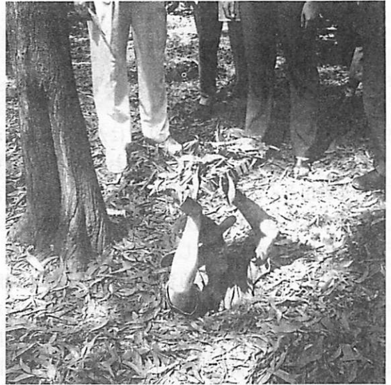
人ひとりがやっと通れるトンネルの秘密出入口

昨秋ベトナムへ出かけた。ホーチミン郊外のク チに、当時総延長250キロにも及んだという、地 下トンネルの一部が残され、観光地となっている。