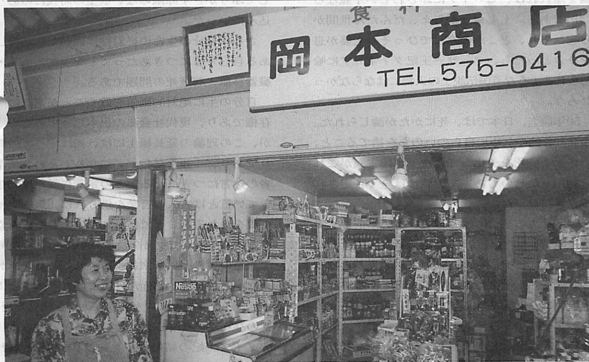
(相田みつをの作品が多く飾ってある神戸震災復興後の風景)